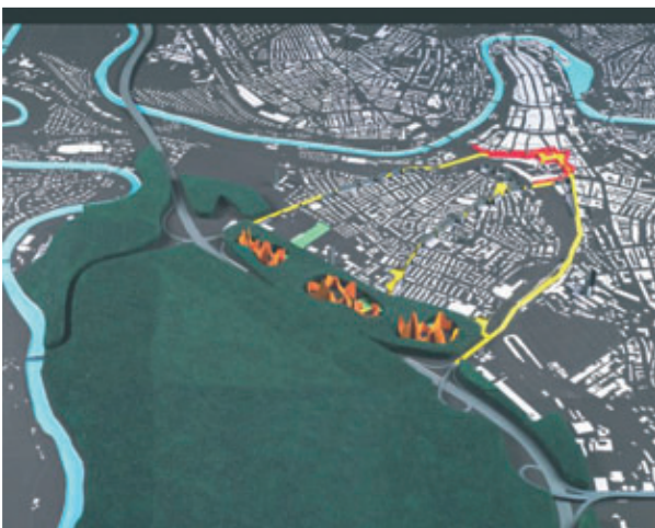
Stadterweiterung in Parkwald: Stadtinseln mit Hochhäusern im Bremgartenwald