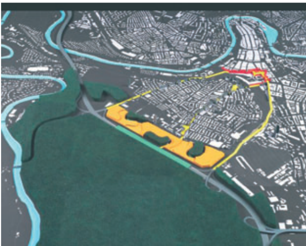
Stadterweiterung mit eigenständiger Stadtstruktur: eine von der Länggasse unabhängige Siedlungsstruktur mit Waldinseln