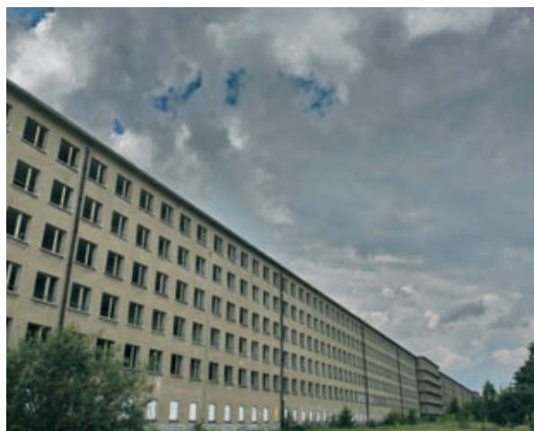
Prora: Wald- und Strandstadt auf der Insel Rügen

Das Projekt Waldstadt sollte sofort abgebrochen werden. Ein so frühes und klares Nein mag heftig erscheinen. Es verhindert aber hohe Kosten und rettet schon jetzt den Bremgartenwald. Als Präsident der SP Länggasse-Felsenau werde ich mich dafür einsetzen, dass die Waldstadt Bremer nie gebaut werden wird.