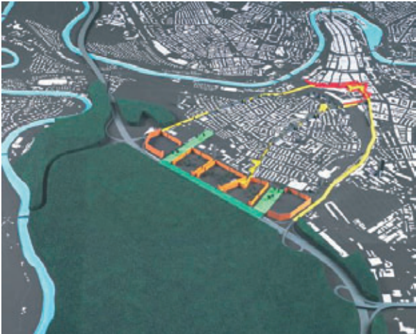
Stadterweiterung als Neuinterpretation vorhandener Stadtstruktur: eine Weiterführung der Stadtstruktur der Länggasse unter zeitgenössischem Verständnis