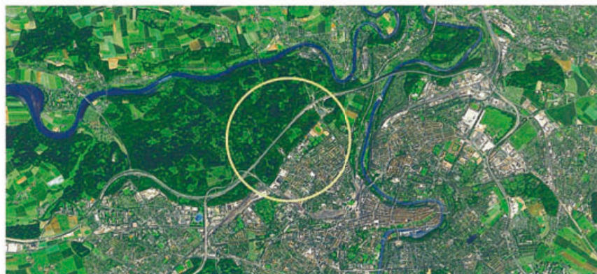
02 Vorschlag zur Stadterweiterung von Bern durch die Waldstadt Bremer

Nachhaltigkeit muss mit konkreten Projekten belegt werden – dies wurde in der Diskussion von verschiedenen Seiten gefordert. Nur über Demonstrationsprojekte kann der Nutzen auf lange Sicht überzeugend belegt und sichtbar gemacht werden. Zudem ist die Initiierung von Modellvorhaben wesentlich, um aus Erfahrungen und Prozessen zu lernen