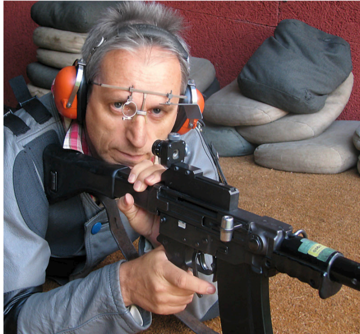
Vereinsleben. Ob Kynologischer Verein Münchenbuchsee, Orchideenfreunde Bern, Fischereiverein Aaretal oder Schützengesellschaft Lyss: Sie und zahlreiche weitere Vereine wurden bisher im Forum vorgestellt.