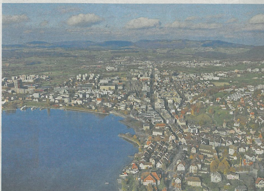
Zersiedelung an schöner Lage: Statt verdichtet wird wie hier in Zug in die Breite gebaut.